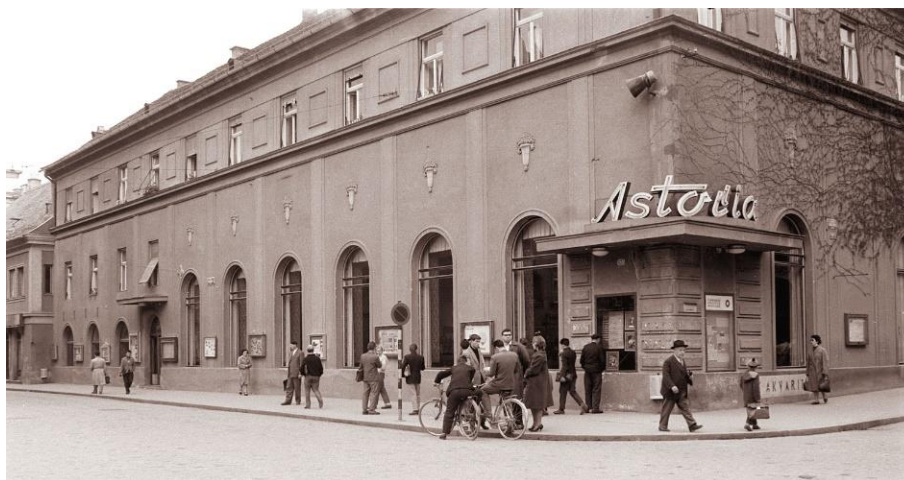
Slika 2: Kavarna Astoria