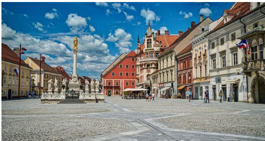
Slika 1: Glavni trg Maribor

Maribor, ki kot drugo največje mesto v Sloveniji predstavlja tudi štajersko prestolnico Slovenije ne slovi samo po vseh arhitekturnih spomenikih, trgih, cerkvah, univerzi ter najstarejši trti na svetu. Slovi tudi po zanimivem nočnem življenju, ki se je ter se tudi še danes odvija v mestu Maribor, zato bomo skozi sprehod po starem nočnem življenju mesta Maribor spoznali najznamenitejše spomenike mariborske scene za zabavo. Kot bi rekli na štajerskem: Ste pripravljeni za »vredi čago« ?